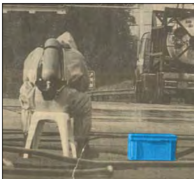
- ein Unfall mit Gefahrgut, RAKO Behälter mit Hilfsmaterial -

Seit vielen Jahren rüstet die Engels-Gruppe die Polizei und Justizbehörden in den Niederlanden mit Kunststoffbehältern aus. Wenn im Fernsehen Bilder von Polizeieinsätzen gezeigt werden, sind auch immer wieder unsere Behälter im Bild. Hier sehen Sie einige Beispiele: