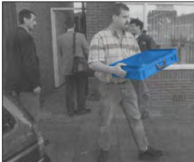
- Abtransport von Beweisstücken in RAKO Behältern -