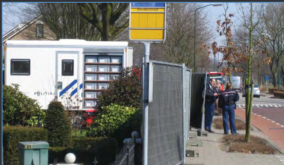
und in der mobilen Einsatzzentrale