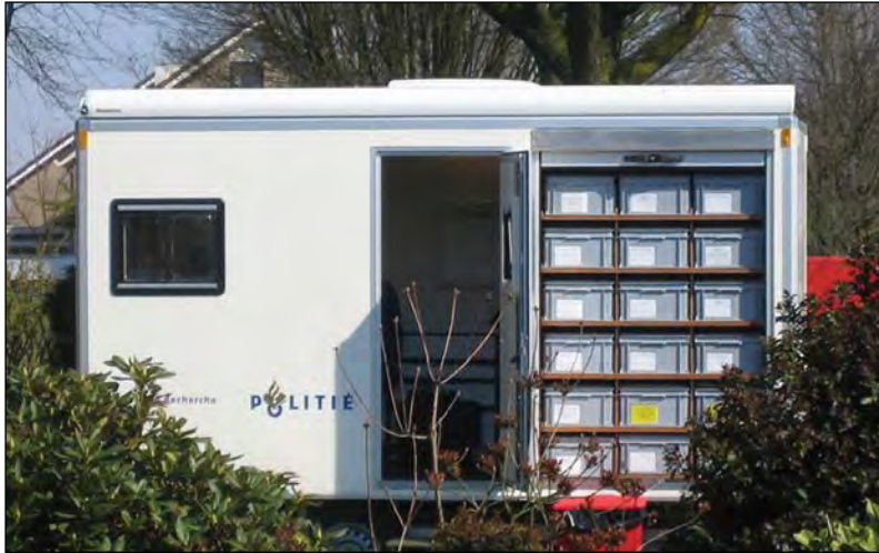
- mobile Einsatzzentrale der niederländischen Verkehrspolizei mit einem RAKO Behältermagazin -

Für unsere robusten RAKO Behälter halten wir ein großes Sortiment an Zubehör bereit. Verschiedene Facheinteilungen, Etikettenhalter, (Block)-Schaumeinlagen und Versiegelungen gehören ebenso dazu, wie unterschiedliche Verschlussmöglichkeiten und Aufdrucke mit Logo oder Standardbuchstaben und Zahlen. Natürlich liefern wir auch die passenden Transportroller dazu.