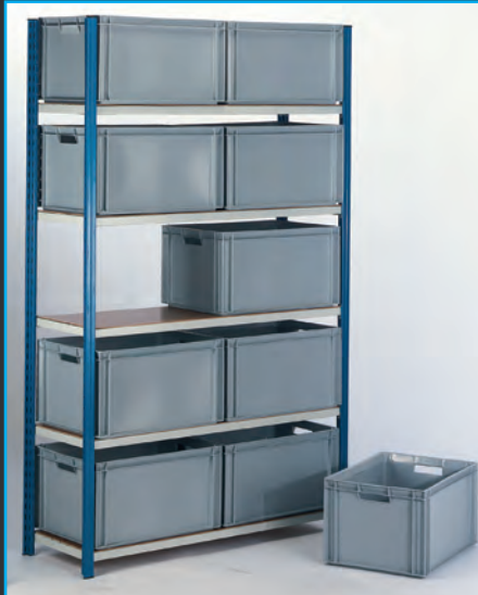
im Archiv und in Asservatenkammern