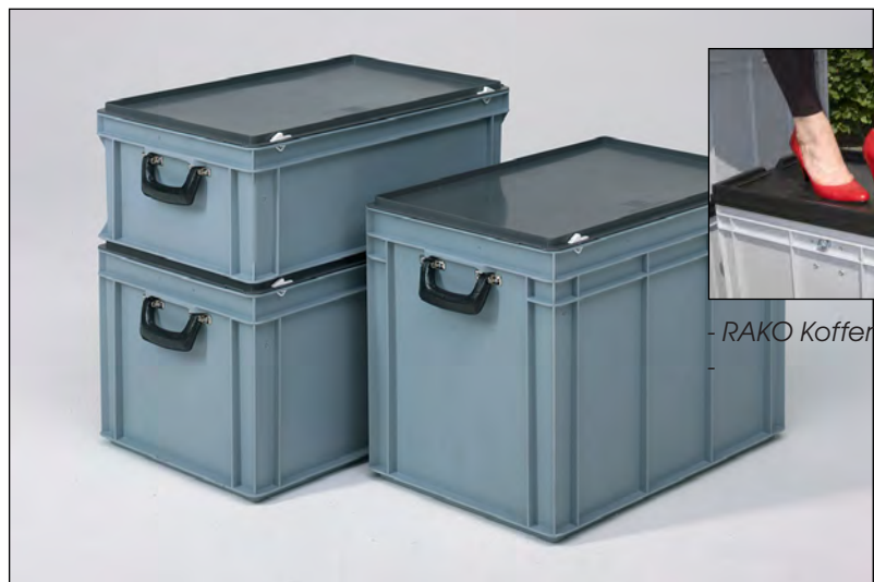
- RAKO Koffer „Heavy Duty“

Zu den vielseitigsten Transport-Behältersystemen gehört die RAKO-Serie. Die Behälter gibt es in unterschiedlichen Grundmaßen und Höhen. Sie sind stabil, stapelbar und mit unterschiedlichen Griffen und Deckelvarianten lieferbar. Von vielen Behältern gibt es auch eine Kofferversion. In der „Heavy Duty“- Version kann man auf den Koffern sogar stehen.