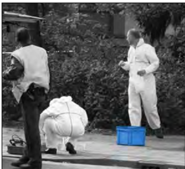
- RAKO Behälter mit der Ausrüstung für die Spurensicherung -

Die meisten Menschen wissen nicht was alles in einem Streifenwagen transportiert werden muss. Die Polizisten müssen für alle möglichen Einsätze gerüstet sein. Von der Ausrüstung zur Absicherung einer Unfallstelle über Erste-Hilfe-Material bis hin zur Kamera und Taschenlampe – alles muss sicher verstaut werden. Selbst das Plüschtier, das Kindern nach einem Unfall Trost spenden soll, muss im Fahrzeug untergebracht werden. Ideal eignen sich hierfür unsere Rako Behälter.