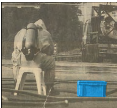
- ein Unfall mit Gefahrgut, RAKO Behälter mit Hilfsmaterial -

Seit vielen Jahren rüstet die Engels-Gruppe die Polizei und Justizbehörden in den Niederlanden mit Kunststoffbehältern aus. Wenn im Fernsehen Bilder von Polizeieinsätzen gezeigt werden, sind auch immer wieder unsere Behälter im Bild. Hier sehen Sie einige Beispiele: