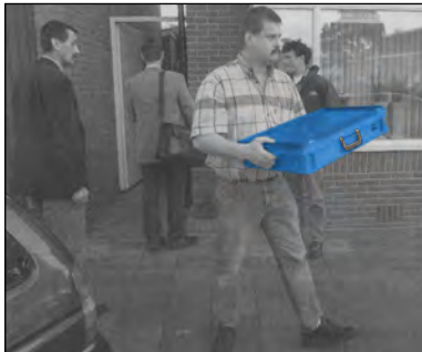
- Abtransport von Beweisstücken in RAKO Behältern -