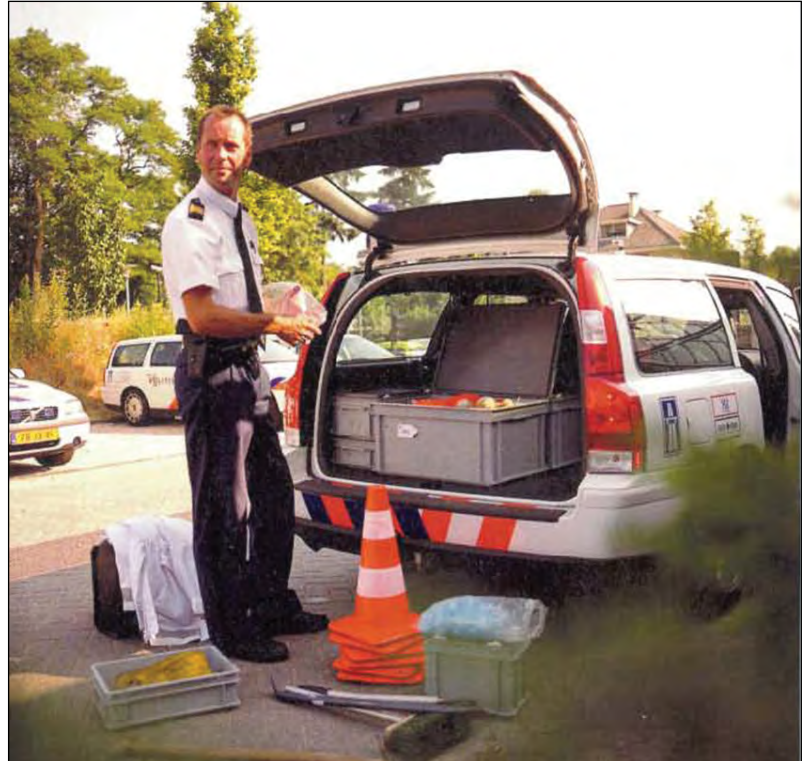
- alles gut verstaut in RAKO Behältern -

Die meisten Menschen wissen nicht was alles in einem Streifenwagen transportiert werden muss. Die Polizisten müssen für alle möglichen Einsätze gerüstet sein. Von der Ausrüstung zur Absicherung einer Unfallstelle über Erste-Hilfe-Material bis hin zur Kamera und Taschenlampe – alles muss sicher verstaut werden. Selbst das Plüschtier, das Kindern nach einem Unfall Trost spenden soll, muss im Fahrzeug untergebracht werden. Ideal eignen sich hierfür unsere Rako Behälter.