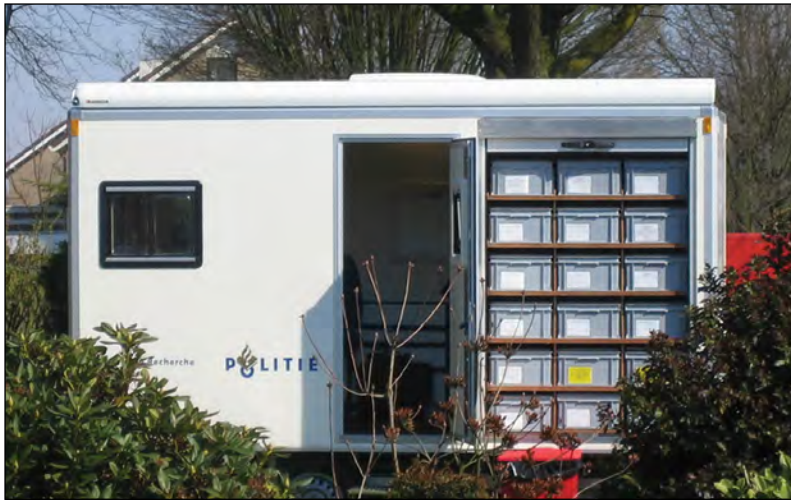
- mobile Einsatzzentrale der niederländischen Verkehrspolizei mit einem RAKO Behältermagazin -

Für unsere robusten RAKO Behälter halten wir ein großes Sortiment an Zubehör bereit. Verschiedene Facheinteilungen, Etikettenhalter, (Block)-Schaumeinlagen und Versiegelungen gehören ebenso dazu, wie unterschiedliche Verschlussmöglichkeiten und Aufdrucke mit Logo oder Standardbuchstaben und Zahlen. Natürlich liefern wir auch die passenden Transportroller dazu.