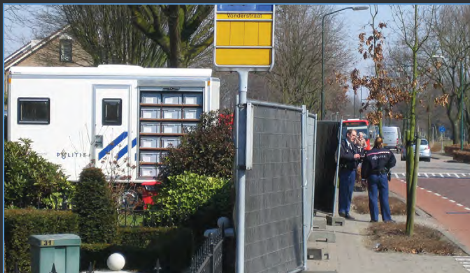
und in der mobilen Einsatzzentrale