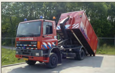
Pour chaque sinistre, le camion peut atteler la remorque appropriée.

Aux Pays-Bas, quand en 1989, l'organisation de la protection civile a été supprimée, les sapeurs-pompiers nationaux ont pris la protection civile en mains. Le matériel a été modernisé et on a opté pour des nacelles aménagées par types d'intervention et identiques pour chaque corps régional. Le matériel de secours est emballé dans bacs et stocké dans des conteneurs roulants. La société Engels a obtenu le marché pour la fourniture de ces bacs. Par conséquent le bac Rako est devenu la norme pour les pompiers néerlandais. En 2006, nous avons remporté l'appel d'offres du SDIS 69 pour les contenants plastique, et depuis nous sommes fournisseurs de nombreux SDIS en France.