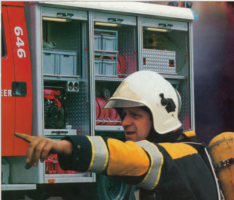
Chaque véhicule d'incendie est équipé de bacs plastique Engels

Avant on devait adapter les bacs à la taille des véhicules. Actuellement, les véhicules sont prévus pour accueillir les caisses norme europe, ainsi la mise à mesure des bacs n'est plus nécessaire. Toutefois nous proposons toujours à la demande du client, des poignées ra battantes des portes étiquettes ou des différents types de marquage.