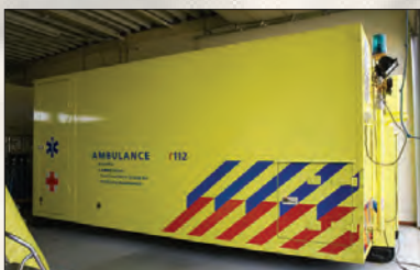
Les pompiers, mais aussi des hôpitaux régionaux ont leur propre conteneur d'intervention (ici de l'UMG (NL))