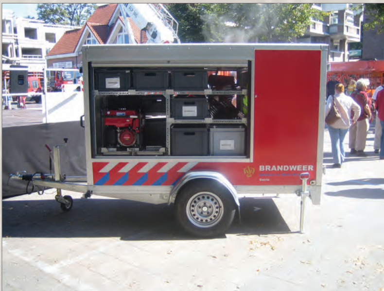
Dans les remorques, des espaces sont prévus pour les bacs Engels.

Avant on devait adapter les bacs à la taille des véhicules. Actuellement, les véhicules sont prévus pour accueillir les caisses norme europe, ainsi la mise à mesure des bacs n'est plus nécessaire. Toutefois nous proposons toujours à la demande du client, des poignées ra battantes des portes étiquettes ou des différents types de marquage.