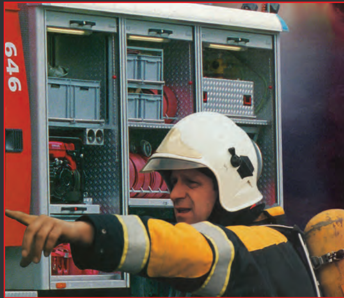
Stockage du matériel dans les véhicules