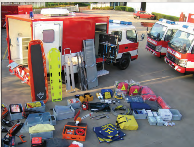
Contenu d'un conteneur de secours pour transports aériens

Grâce aux équipements standardisés, le personnel de chaque corps peut trouver facilement le matériel dans les conteneurs d'un autre corps. Pendant les interventions, le stress est inévitable, le gain de temps en recherche de matériel est indispensable, ainsi les équipes sont plus concentrées sur leur mission.