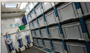
Des bacs de pansements dans une nacelle médicale