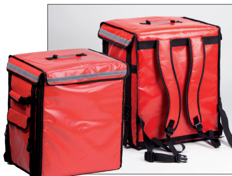
Sac à dos isotherme avec étagères ajustables.

Il est de plus en plus difficile de trouver des collaborateurs ayant un permis scooter, car les jeunes peuvent rouler en conduite accompagnée dès l'âge de 17 ans. Pour pallier ce problème, Engels a mis au point une Bicycle Delivery Box (boîte de livraison pour vélo). Des jeunes peuvent ainsi distribuer des marchandises à vélo.