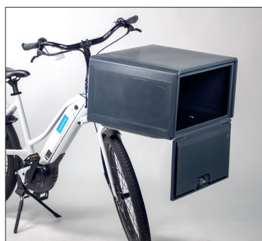
Caisson léger pour le support de devant pour vélo.

Grace à notre propre bureau d'études et production nous pouvons vous fabriquer facilement votre propre caisson de livraison en polypropylène alvéolaire sur mesure.