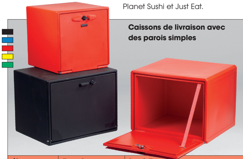
Caissons de livraison avec des parois simples

Les caissons de livraison en plastique dur sont robustes et résistant aux intempéries. Ils sont aptent pour une utilisation quotidienne par des professionnels. Nous avons livrés déjà quelques 10.000 bacs partout en Europe. Ils sont utilisés entre autre par le Bpost, Sushi Shop, Planet Sushi et Just Eat.