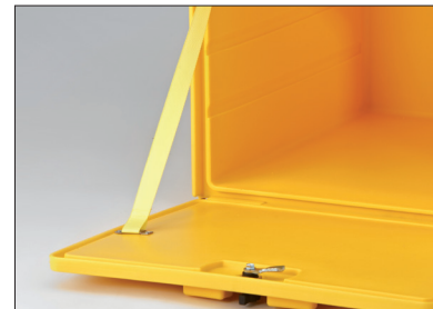
Sangle de maintien de couvercle en polyester très résistant.

Le Food Delivery Box est un caisson à double parois isotherme. Avec ce caisson ce n'est pas nécessaire d'utiliser un emballage intérieur isolant. La FDB est, de série, munie de réflecteurs, de larges emplacements latéraux pour autocollants publicitaires et, sur la partie supérieure, de rebords de chute pour poser un casque ou un petit paquet une fois à l'arrêt.