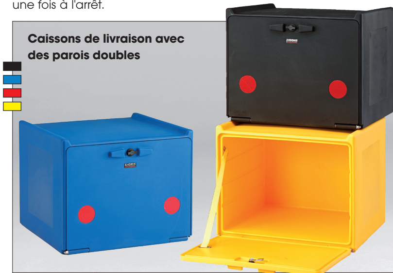
Caissons de livraison avec des parois doubles

Le Food Delivery Box est un caisson à double parois isotherme. Avec ce caisson ce n'est pas nécessaire d'utiliser un emballage intérieur isolant. La FDB est, de série, munie de réflecteurs, de larges emplacements latéraux pour autocollants publicitaires et, sur la partie supérieure, de rebords de chute pour poser un casque ou un petit paquet une fois à l'arrêt.