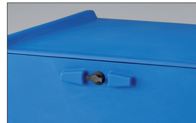
Fermeture pivotante, serrure cylindrique sécurisée en option.