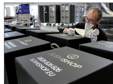
Nous pouvons vous fournir des Scooterbox avec un texte ou votre logo grâce à la sérigraphie ou à un autocollant sur mesure.