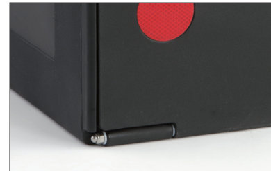
Axe de charnière en acier inoxydable, non débordant pour plus de sécurité.